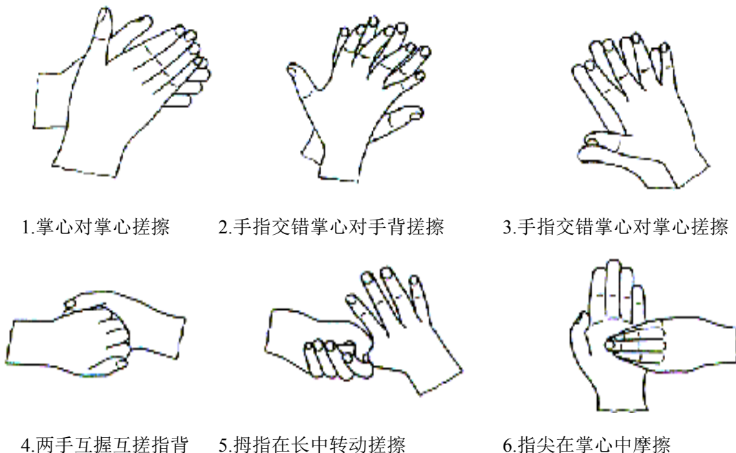
图2-1 标准的洗手方法

(9)参考样品组:对于卫生手消毒,取60%异丙醇3ml到入手心中,按标准的洗手方法用力搓擦30s。以确保手的所有部位均匀接触异丙醇。重复使用异丙醇按上述方法搓擦使总的搓擦时间为60s。对于外科手消毒,使用60%正丙醇3ml,按标准的洗手方法用力搓擦,当接近干燥时,再加3ml正丙醇搓擦。以保持作用3min。用流动的自来水冲洗5s,抖掉手上残留的水。其余步骤与试验样品组相同。