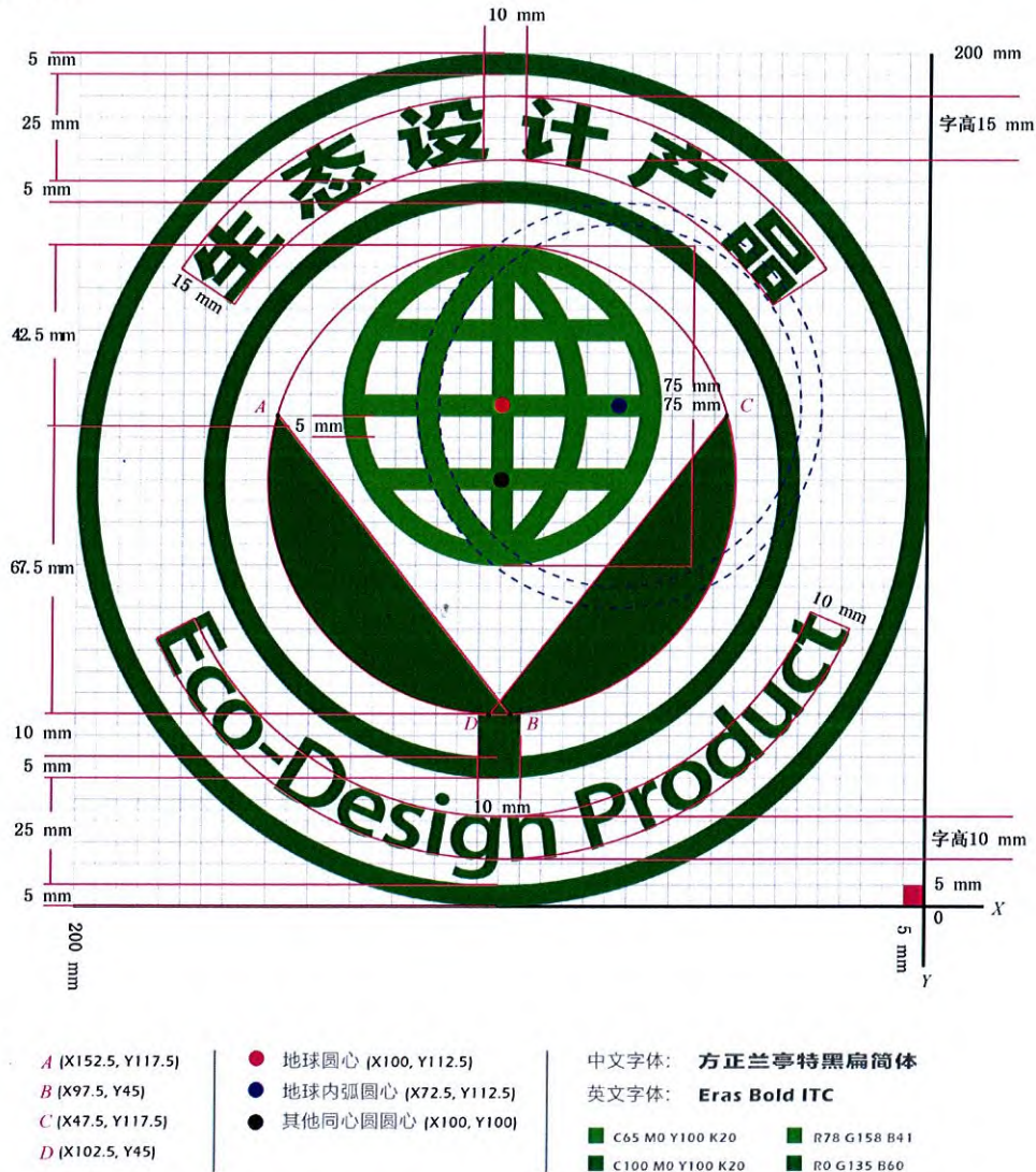
图 A.1 生态设计产品标识图样及尺寸

生态设计产品标识图样及尺寸见图 A.1,其中 A、B、C、D 为同一个圆上的四个点,用以确定绿色叶片的位置和大小,红色、蓝色和黑色的三个点为三个同心圆的圆心。上述各点的坐标、中英文字体和颜色如图 A.1 所示。