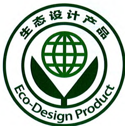
图 1 生态设计产品标识