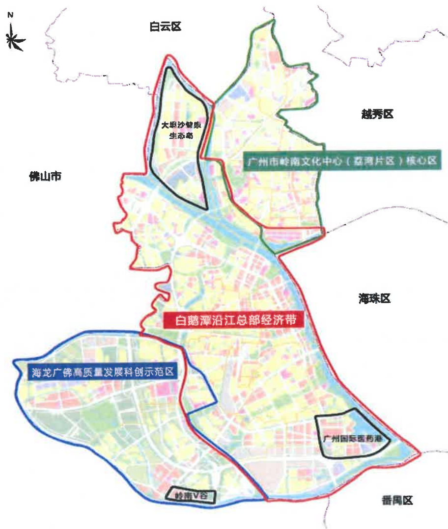
图 1: “一带两区”发展新格局示意图