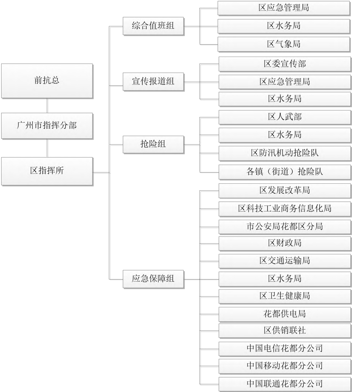
附件 2 区指挥所组织体系图