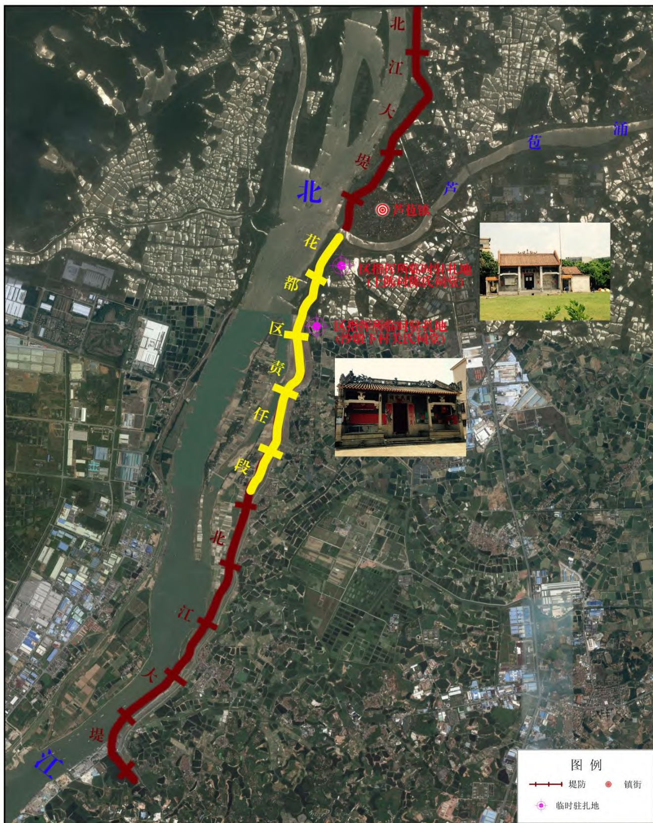
附图 1 北江大堤广州市花都区责任段地理位置示意图