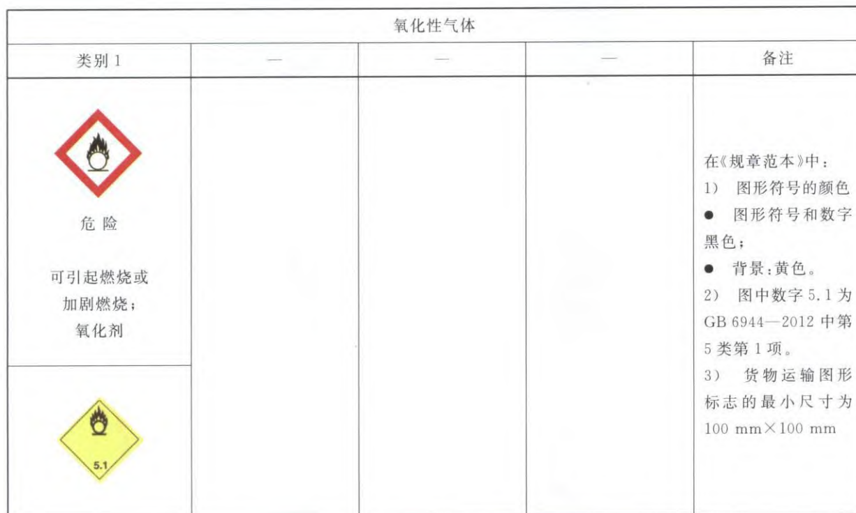
表 B.1 氧化性气体标签要素的分配