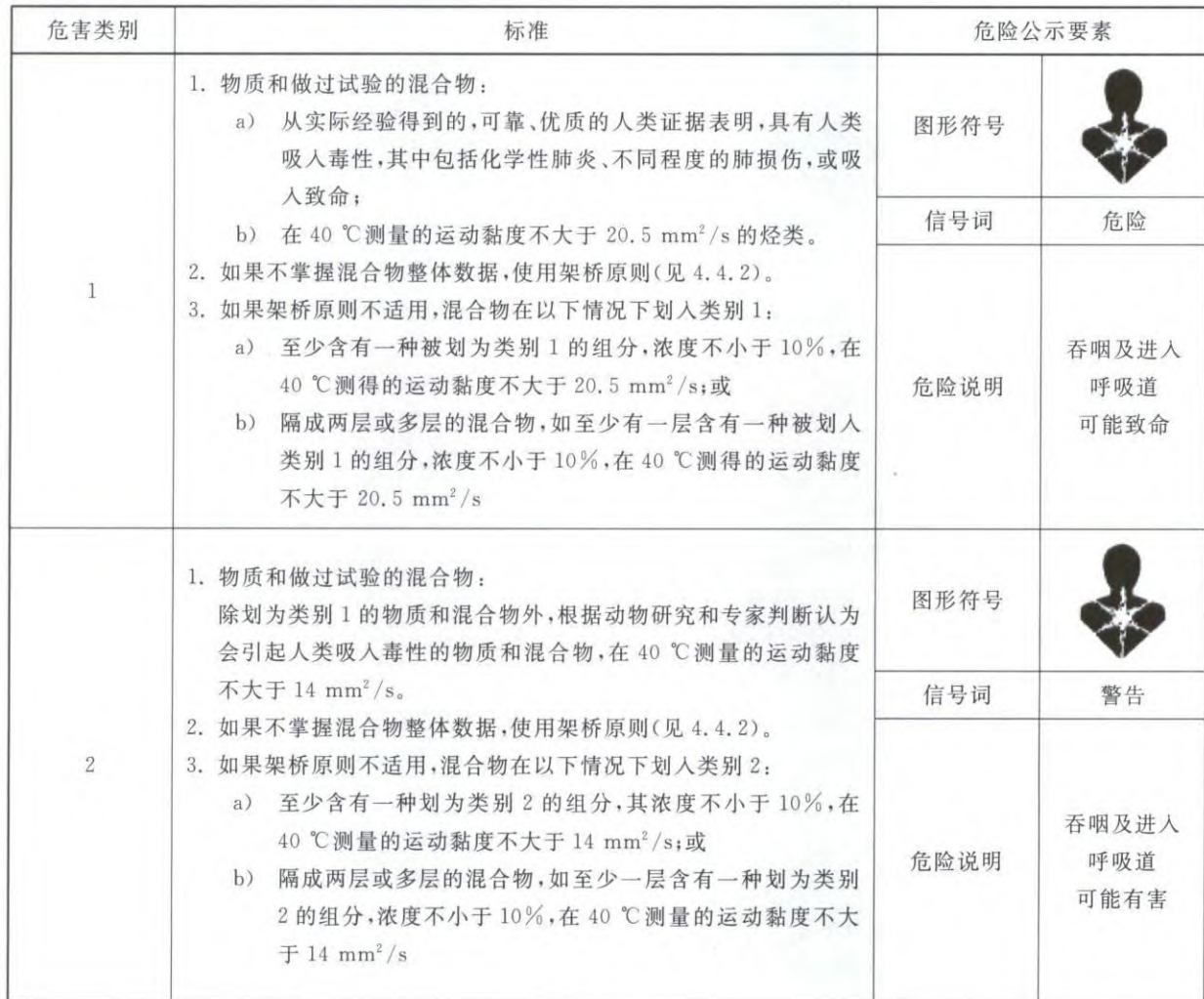
表 D.1 吸入危害分类和标签