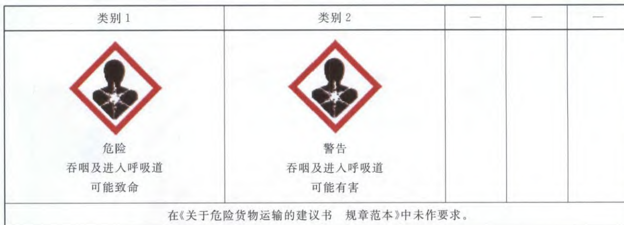
表 C.1 吸入危害的标签要素配置表