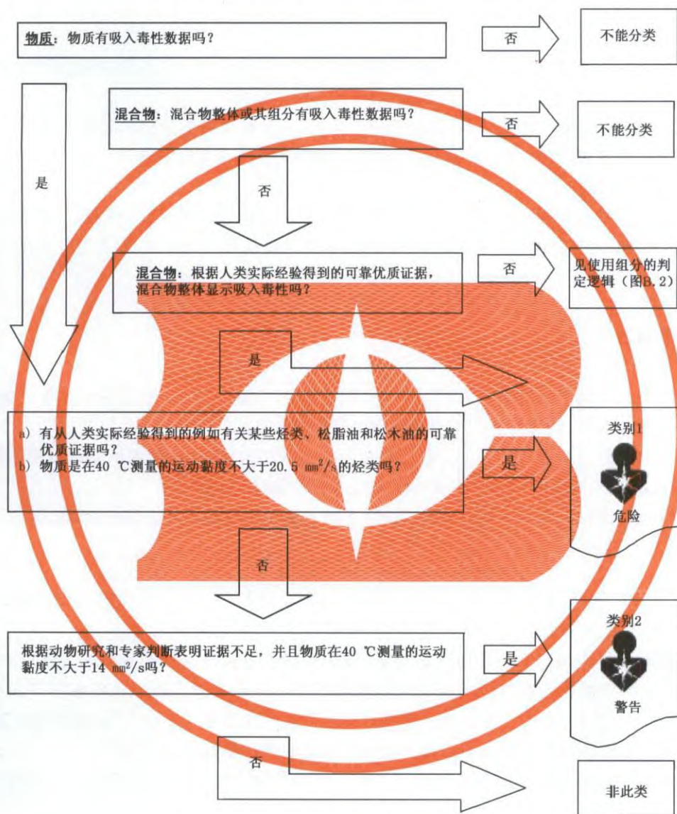
图 B.1 吸入危害判定逻辑