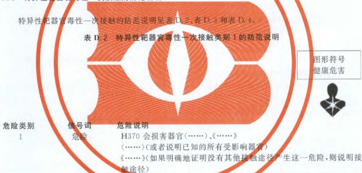
表 D.2 特异性靶器官毒性一次接触类别 1 的防范说明