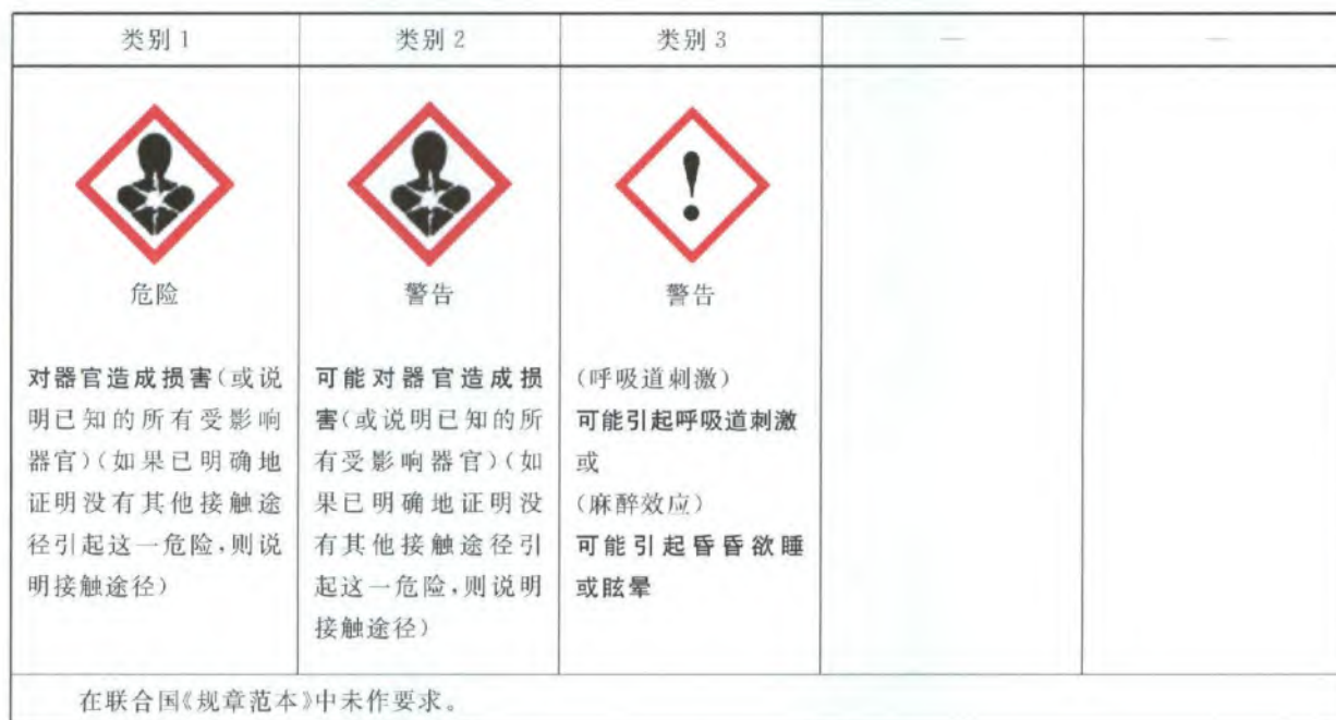
表 B.1 特异性靶器官毒性一次接触标签要素的分配