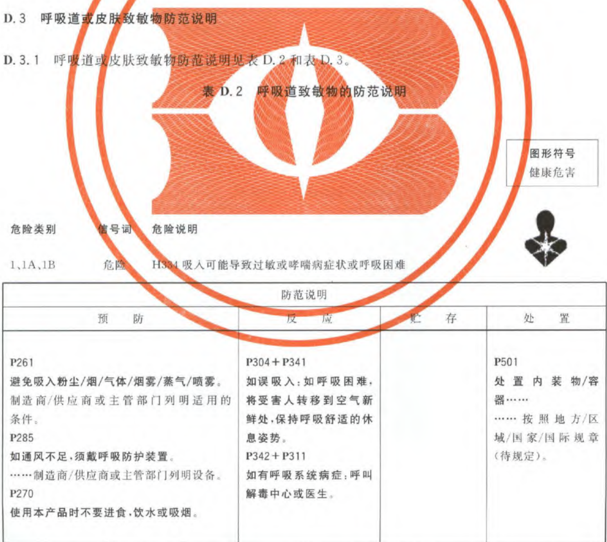
表 D.2 呼吸道致敏物的防范说明