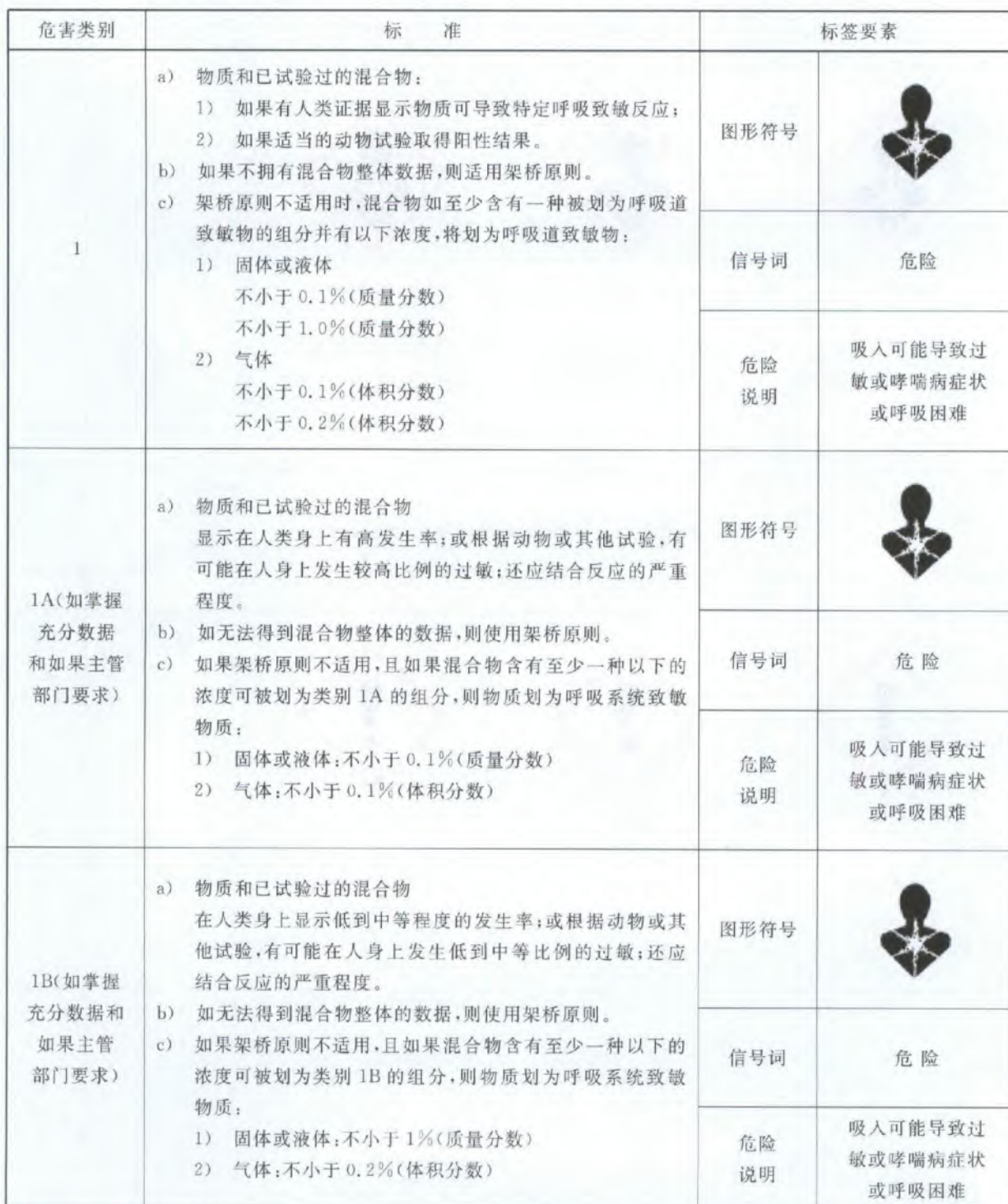
表 C.1 呼吸道致敏物的分类标准和标签要素