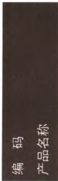
F.1 皮肤腐蚀/刺激类别 1 标签的样例(见图 F.1)