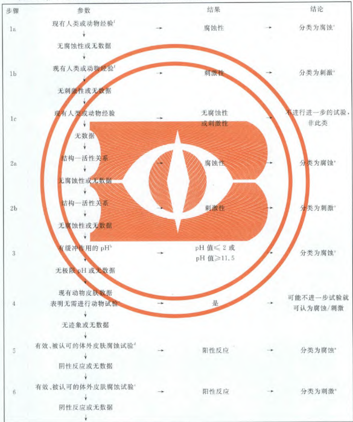
图 A.1 皮肤腐蚀/刺激的分层试验和评估策略