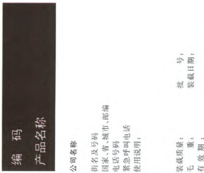
F.3 皮肤腐蚀/刺激类别 3 标签的样例(见图 F.3)