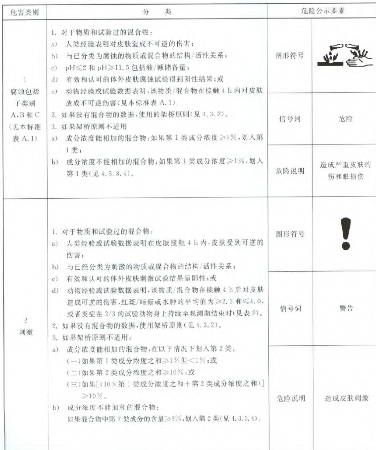
表 D.1 皮肤腐蚀/刺激分类和标签要素