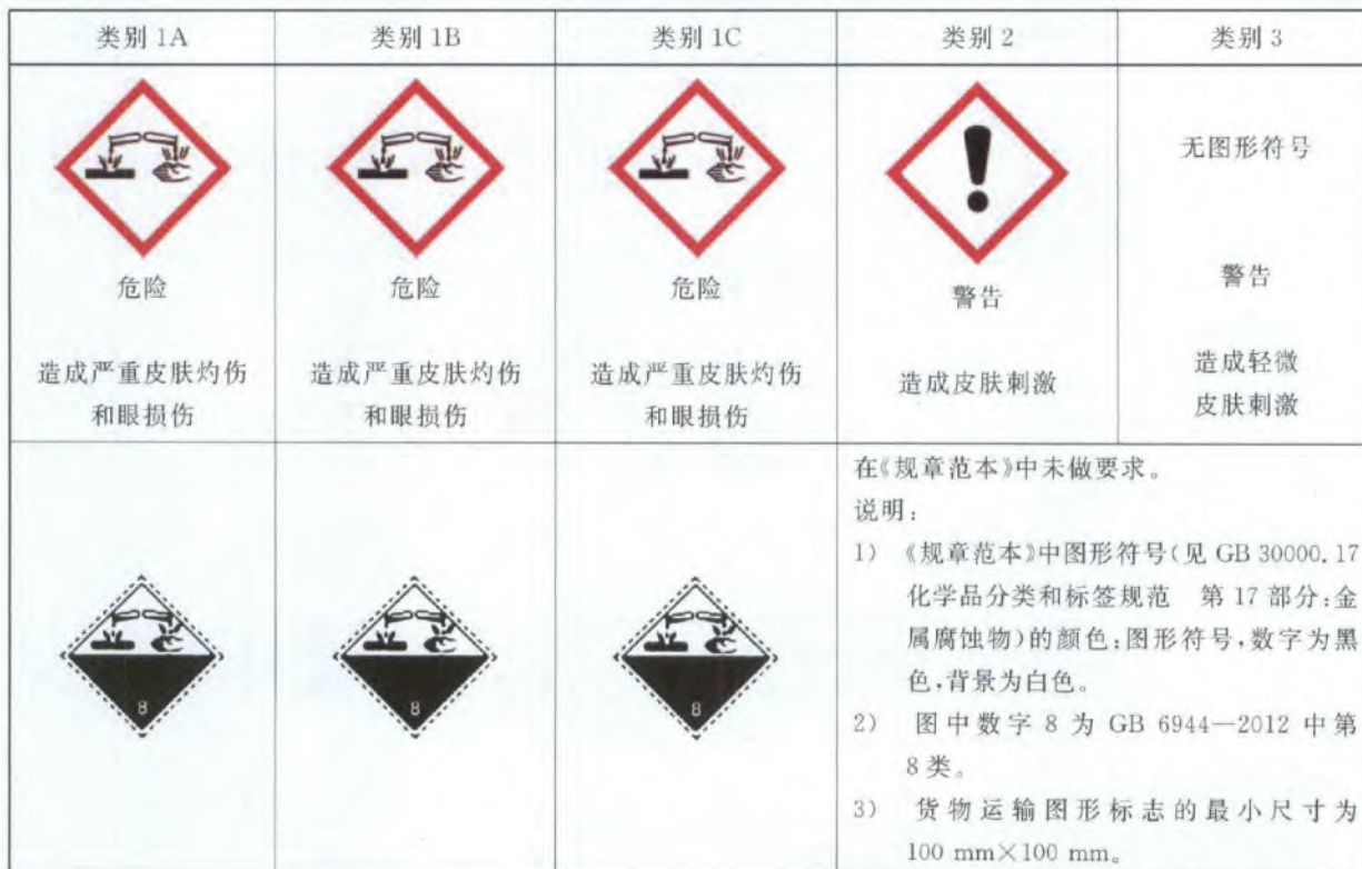
表 C.1 皮肤腐蚀/刺激标签要素的分配