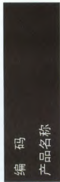
F.2 皮肤腐蚀/刺激类别 2 标签的样例(见图 F.2)