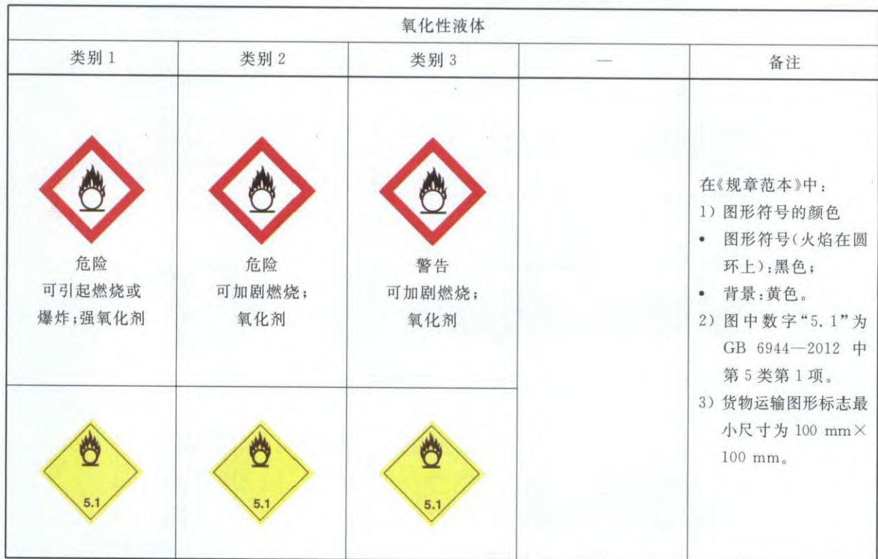
表 B.1 氧化性液体标签要素的分配