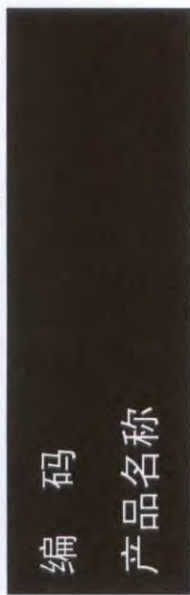
E.1 氧化性液体类别 1 标签示例见图 E.1。