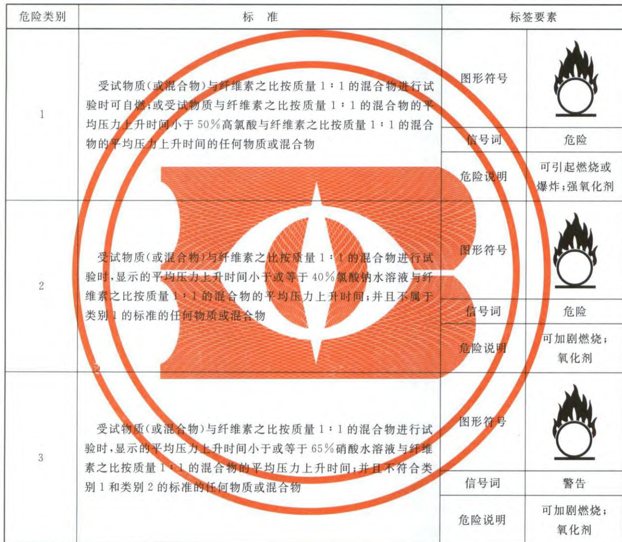
表 C.1 氧化性液体分类标准和标签要素