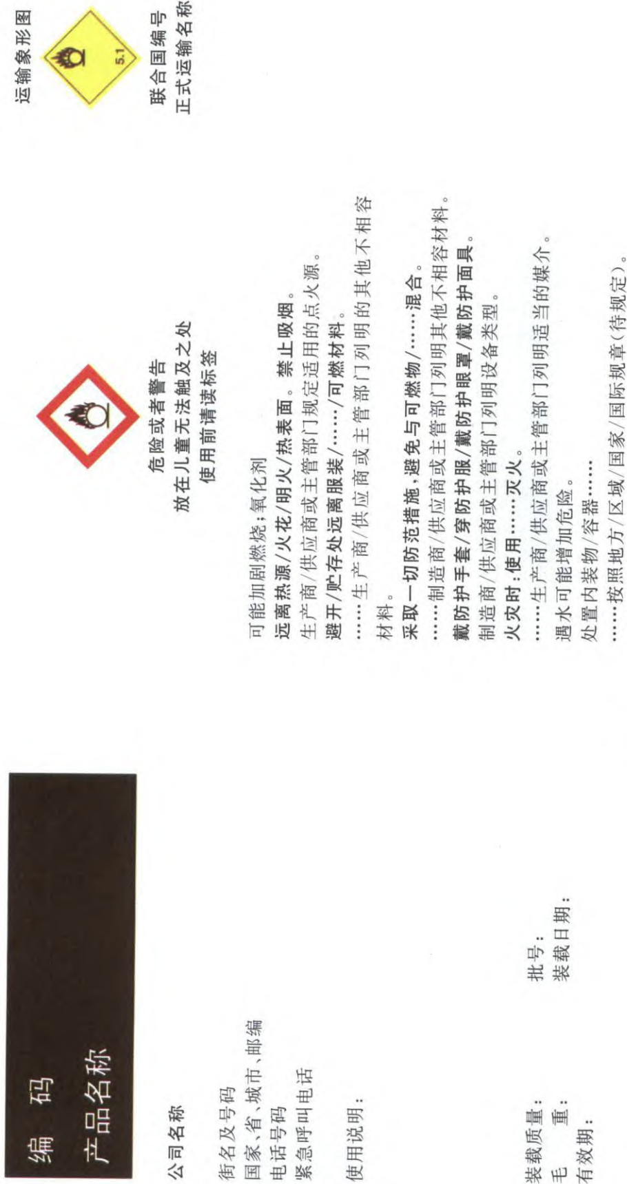
图 E.2 氧化性液体类别 2 和类别 3 的标签