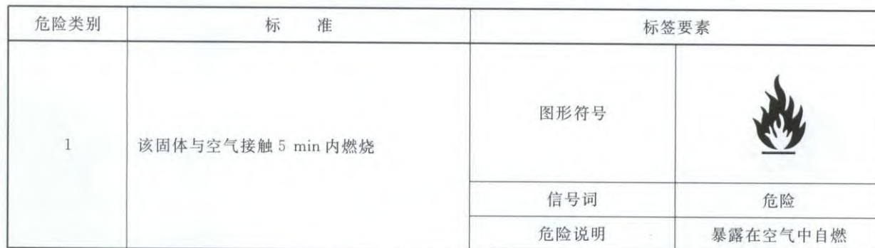
表 C.1 自燃固体分类标准和标签要素