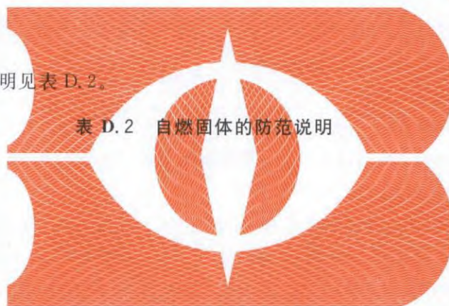
表 D.2 自燃固体的防范说明