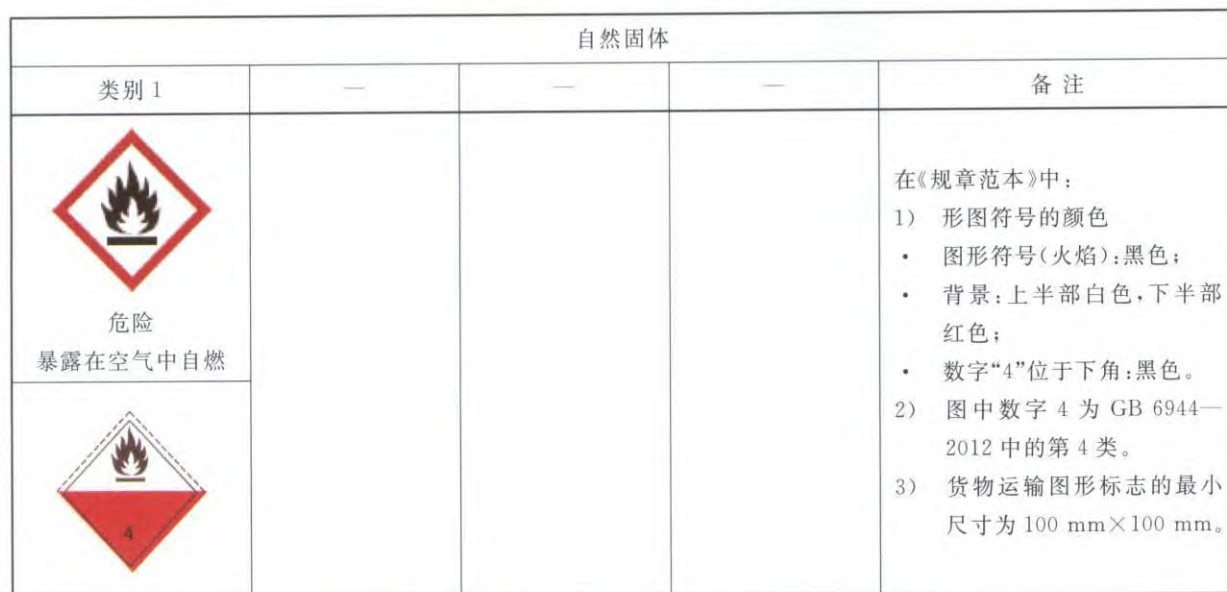
表 B.1 自燃固体标签要素的分配