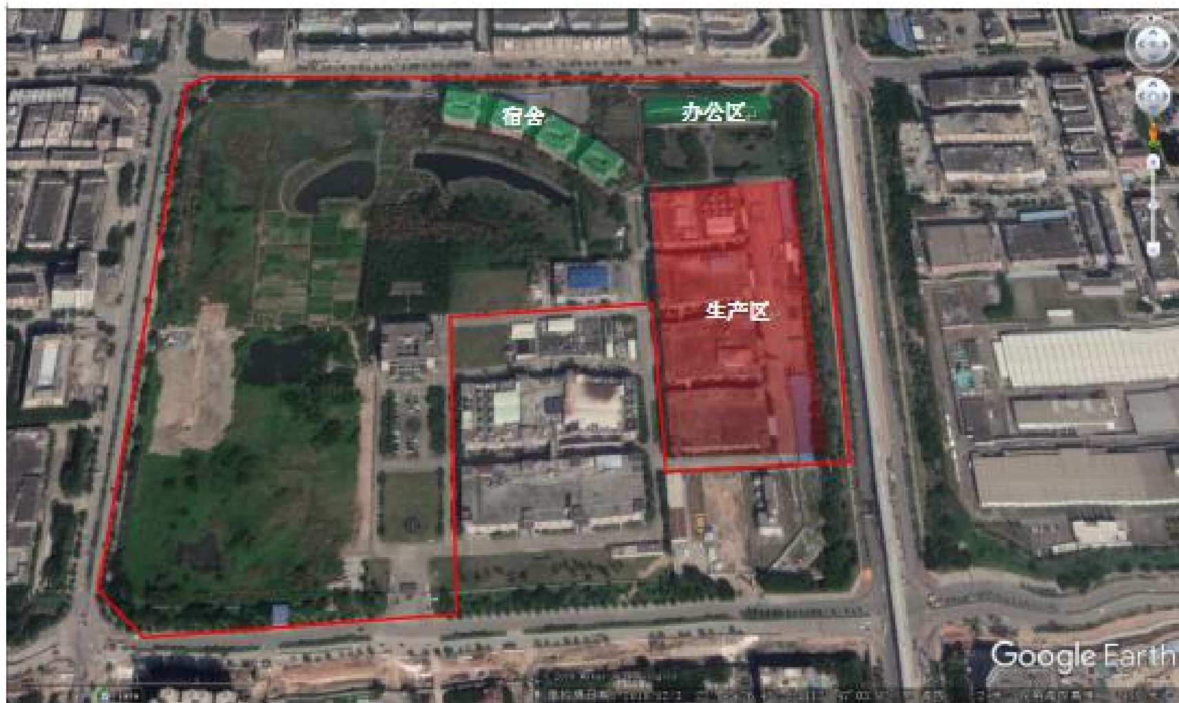
图 1.1-2 公司平面布置图