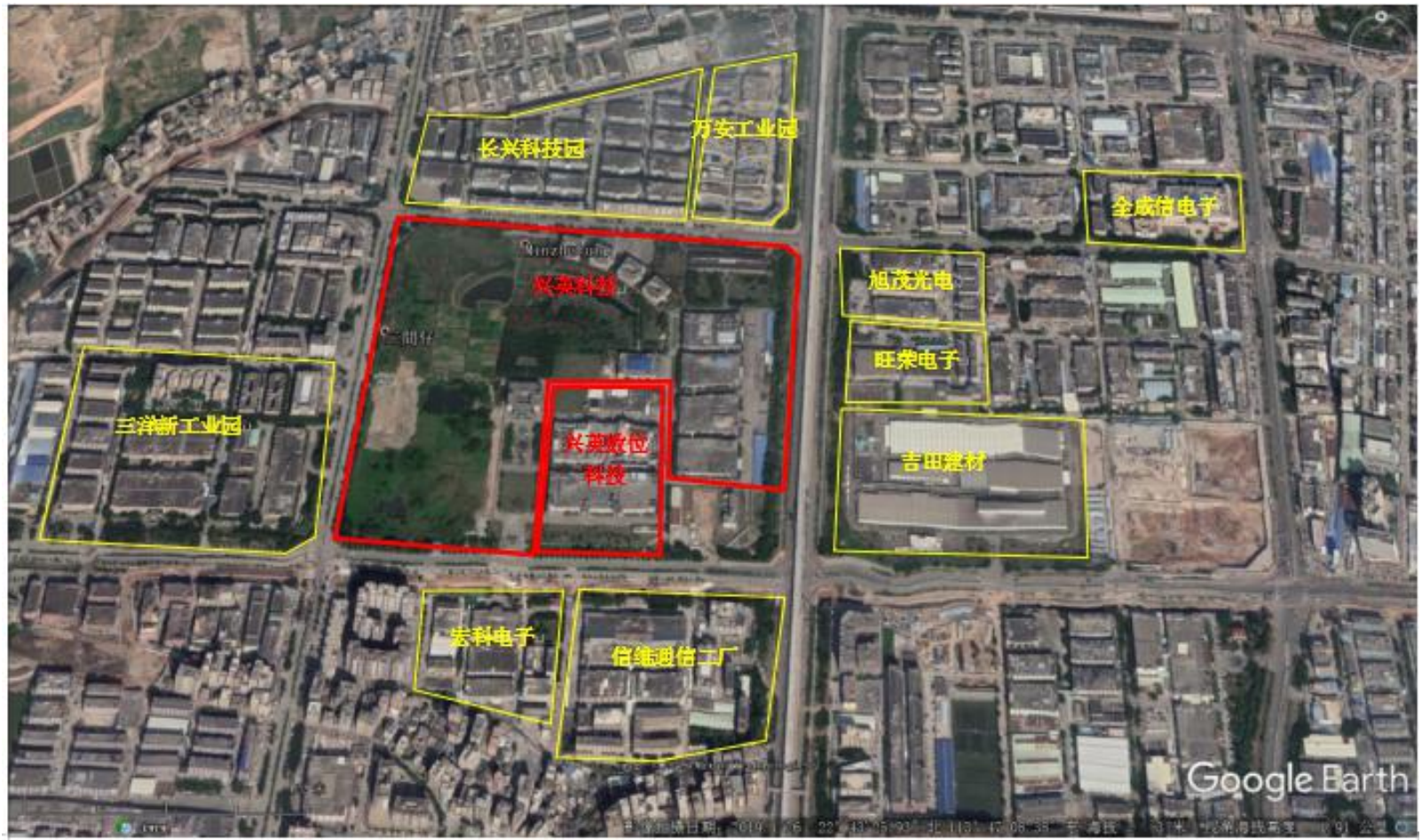
图 1.1-1 公司四至图